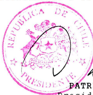
Patricio Aylwin Azocar PATRICIO AYLWIN AZOCAR Presidente de la República