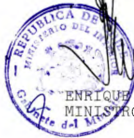
ENRIQUE KRAUSS RUSQUE MINISTRO DEL INTERIOR