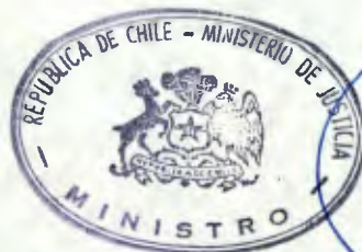
FRANCISCO CUMPLIDO CERECEDA Ministro de Justicia