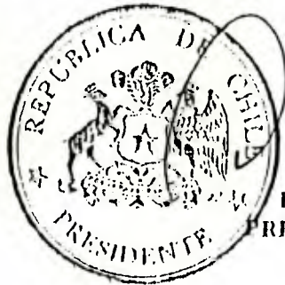
Patricio Aylwin PATRICIO AYLWIN AZOCCA PRESIDENTE DE LA REPUBLICA