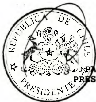
Patricio Aylwin Azocar PATRICIO AYLWIN AZOCAR PRESIDENTE DE LA REPUBLICA