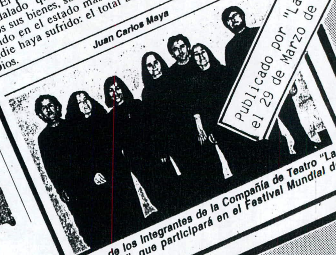
Siete de los integrantes de la Compañía de Teatro "La Catedral", que participará en el Festival Mundial de Teatro.

Publicado por "La Tercera" el 29 de Marzo de 1993