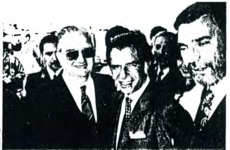
En el Hotel Tolkeyén de Ushuaia el Presidente argentino Carlos Saúl Menem y el intendente de Magallanes, Roque Tomás Scarpa tuvieron oportunidad de dialogar por algunos momentos. A la derecha aparece el gobernador de Tierra del Fuego, José Arturo Estabillo.

Señaló por último que esa actuación de Menem anticipaba lo que hoy día es: una gran figura y que "muchos no se imaginaban la envergadura nacional e internacional que está logrando