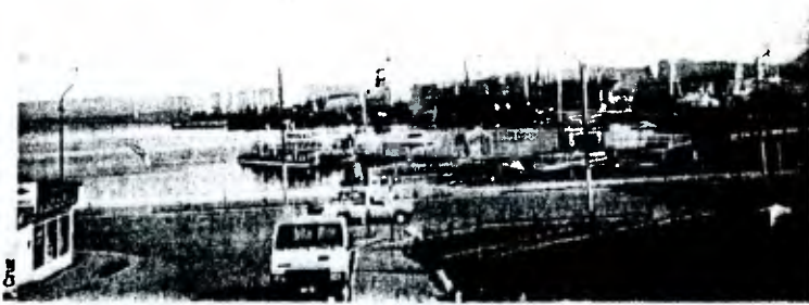
Puerto de Ushuaia, de gran movimiento marítimo. El Presidente Menem anunció aquí que se llamará a licitación para construir un nuevo puerto.

Por su parte el Primer Mandatario argentino tras la ceremonia de firma de