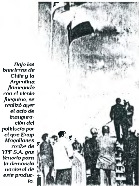
Bajo las banderas de Chile y la Argentina flameando con el viento fuertísimo, se realizó ayer el acto de inauguración del poliducto por el que Enap Magallanes recibe de YPF S.A. gas licuado para la demanda nacional de este producto.

Primer resultado de acuerdos entre Aylwin y Menem