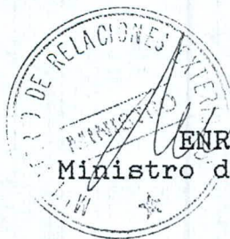
ENRIQUE SILVA CIMMA Ministro de Relaciones Exteriores