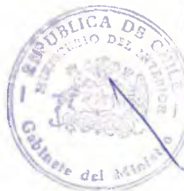
ENRIQUE KRAUSS RUSQUE Ministro del Interior