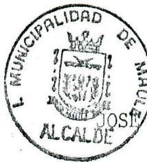
SEBASTIAN PARRA ZUÑIGA Alcalde

Reconocido de su disposición de servicio comunitario, saluda fraternalmente a Ud.,