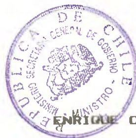
ENRIQUE CORREA RIOS Ministro Secretario General de Gobierno