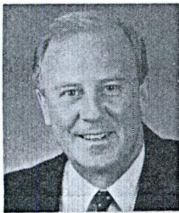
SENATOR BADEN TEAGUE Senator for South Australia

6 WATERLOO STREET GLENELG, S.A. 5045 TEL: (08) 294 9299 FAX: (08) 376 0478 PARLIAMENT HOUSE CANBERRA, A.C.T. 2600 TEL: (06) 277 3760 FAX: (06) 277 3759