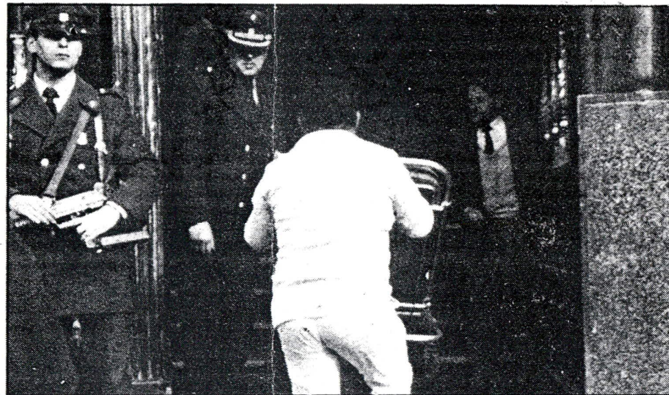
Un enfermero ingresa una camilla para retirar al suboficial herido.

Finaliza indicando que "una vez más, decimos, la violencia de cualquier origen no puede ser