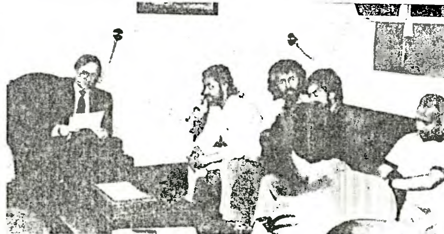
• El subsecretario del Interior, Belisario Velasco, conversa con dirigentes de Lozapenco en la audiencia de ayer.

subsecretario del Interior respecto de otras gestiones hoy al mediodía posiblemente. Sin embargo, insistió en que "nos vamos totalmente defraudados y enfrentamos que una vez más los trabajadores han sido burlados. Vinimos con mucha esperanza en la solución y nos vamos muy decaídos. No hayamos qué decirle a nuestra gente que ha marchado desde Penco para buscar una solución, que buscan lo justo, que buscan lo que a ellos les corresponde, lo que les corresponde a todos. No estamos pidiendo reajuste, o estamos pidiendo