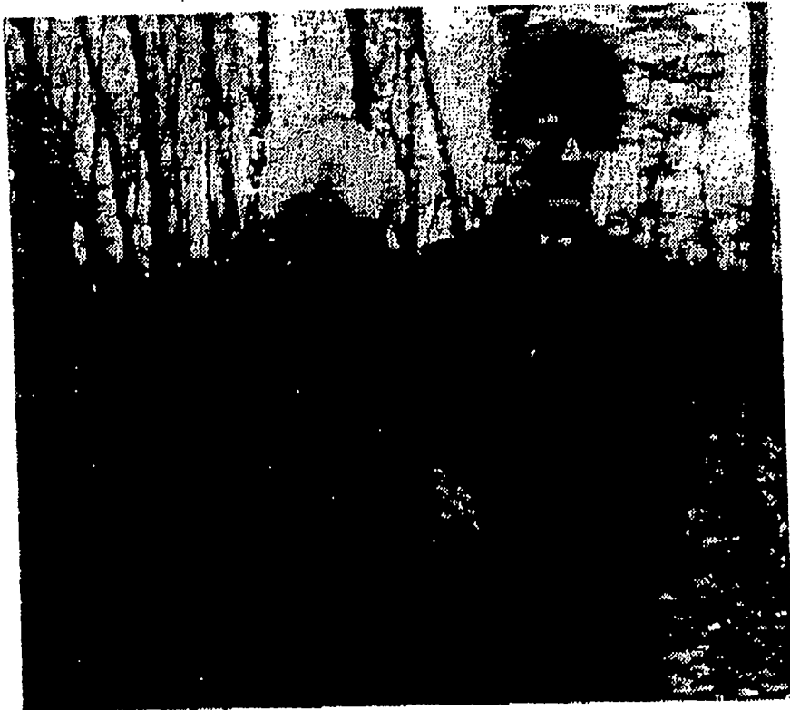
Wie krank ist Honecker wirklich? Der frühere SED-Chef, auf dem Foto mit Frau Margot in Moskau, hofft auf die Ausreise nach Chile

Das gleiche hatten am Vorabend schon der russische Geschäftsträger in Bonn im Gespräch mit Staatssekretär Kastrup und Justizminister Fjodorow gegenüber dem deutschen Botschafter in Moskau, Blech, betont. Sollte Honecker die chilenische Botschaft verlassen, werde er verhaftet, erklärten beide. Allerdings wäre, falls medizinisch notwendig, auch seine Überführung in ein Moskauer Krankenhaus möglich. Doch darum gehe