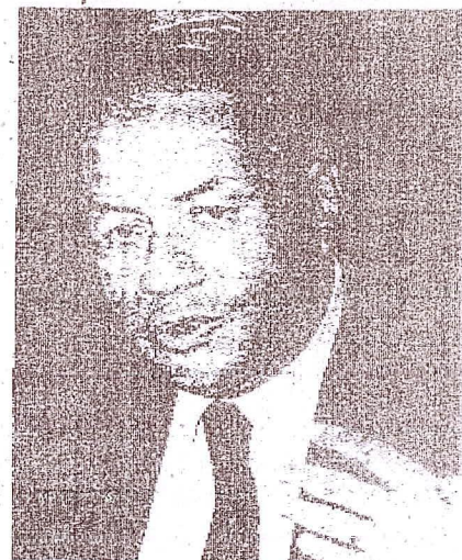
Oscar de la Puente Raygada, presidente del Consejo de Ministros y titular de Relaciones Exteriores.

Admitió que algunas partes de dicho predio, del cual dice no está protegido por las disposiciones del Tratado del 29, fueron utilizadas sin consentimiento del Estado peruano y que otra parte estará afectada por la ampliación de la Carretera Panamericana. "Sin embargo, el acuerdo al que hemos llegado, más allá de la compensación económica ofrecida, es muy satisfactorio en el marco de las características de armonía y colaboración que presiden ahora las relaciones peruano-chile-