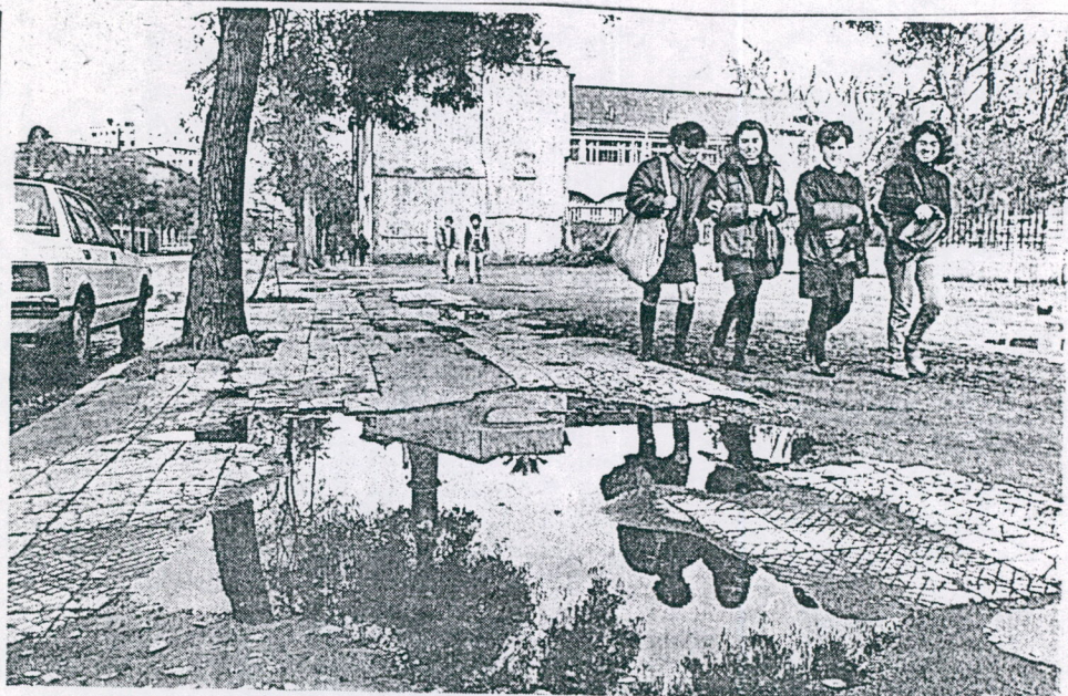
CHARCOS EN LA VEREDA. - Las lluvias desnudan la triste realidad de las calles santiaguinas. Observen lo que pasa en Matucana, altura del 558. Las viejas baldosas desaparecieron hace mucho y los hoyos que dejaron se rellenan de agua. Las colegialas deben sortear el obstáculo saliendo al barro vecino. Se aprecia que en toda la cuadra la acera está en estado deplorable. Sugerimos que sea reembaldosada cuanto antes.

El pasado 28 de marzo se publicó en el diario "La Nación" un listado de preselección de postulantes asignados con vivienda básica con un puntaje inferior al nuestro en "Pudahuel", comuna a la cual nuestro organismo está postulando; cabe hacer notar que el puntaje actual de nuestro Comité supera a muchos puntajes publicados en ese diario.