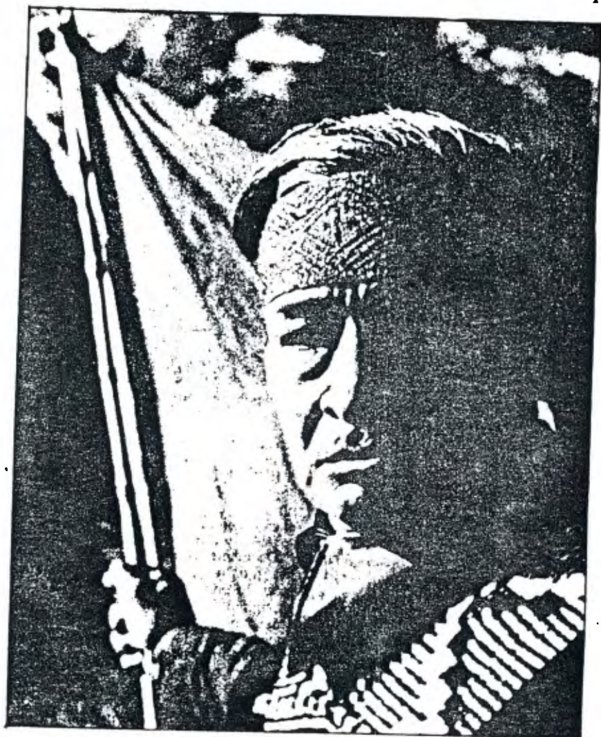
Indien Mapuche, centre-sud du Chili

Étroit couloir séparant les Andes de la mer, le Chili possède une géographie diversifiée et isolée, où des cultures préhispaniques, dont les descendants forment les «minorités ethniques» actuelles, ont acquis différents degrés de développement technologique et religieux (voir ci-dessous). Actuellement, le métissage physique et culturel rend problématique la distinction entre les indigènes et les Blancs, même si les mœurs traditionnelles ont perduré dans la musique, l'artisanat et certains rites hérités de l'animisme primitif, organisés autour du culte de la nature, des morts et de divinités personnalisées associant les principes masculin et féminin. De nombreuses momies exhumées au Chili témoignent de la richesse du passé spirituel et culturel américain; certaines, telle celle d'un enfant montrée dans l'exposition, sont les plus anciennes du monde, antérieures aux momies égyptiennes. Cette pratique de la momification s'étendait aux bébés et même aux fœtus. La musique, liée à la vie sociale et sexuelle, l'art rupestre (géoglyphes, pétroglyphes et peintures), la poterie, qui dénote un style original, le textile, plus raffiné que l'équivalent européen à l'époque des conquêtes, la joaillerie, inspirée du modèle inca, les ornements