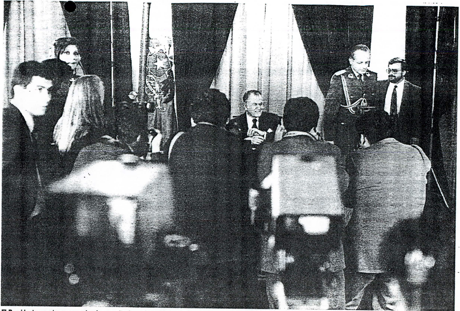
El Presidente anoche expuso al país sus criterios sobre el tema de la reconciliación nacional y la justicia.

“Otros consideran la tramitación de esos juicios como una exigencia natural del Estado de Derecho, que en presencia de hechos que revisten caracteres de delito, exigen el debido proceso para su esclarecimiento y la determinación de las responsabilidades que correspondan. Es lo que plantean, especialmente, los sectores vinculados a las