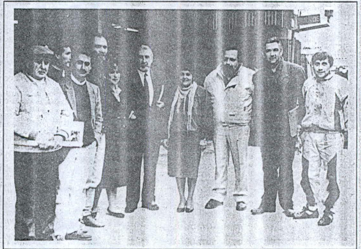
Senador Mariano Ruiz Esquide junto a locatarios de la Vega de Los Angeles.