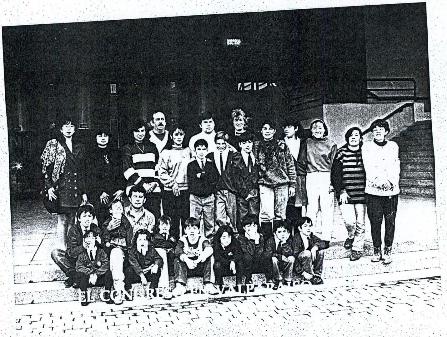
EL CONCERT EN VALPARAISO