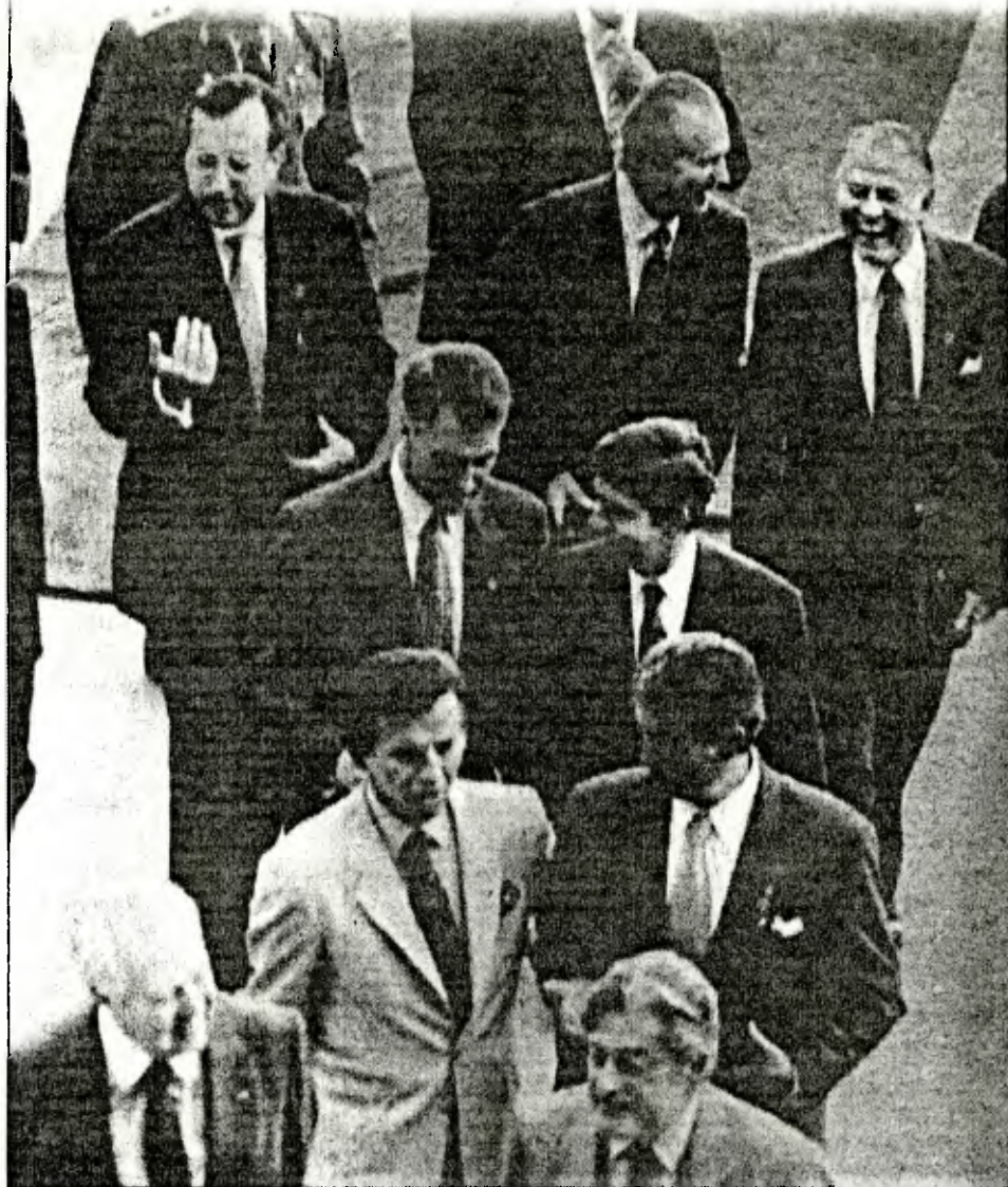
Los mandatarios asistentes a la cumbre de Salvador ingresan al salón donde se realiza la cita. Entre ellos, el Presidente Aylwin, quien aparece bromeando con el Rey Juan Carlos de España.