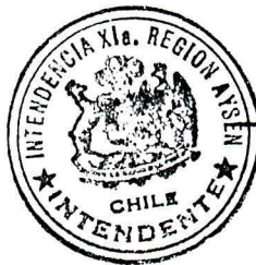
[Handwritten signature] GUSTAVO VILLARROEL PINILLA Intendente XI Región Aisén Subrogante