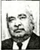
Luis Herrera Campíns

El pueblo de Chile ha dado el sábado 11 de este mes una nueva lección democrática. Por algo es Chile el país de más lúcida y calificada conducción política civil del continente americano. En realidad no la pudieron opacar los 17 años de la dictadura autocrática del general Augusto Pinochet.