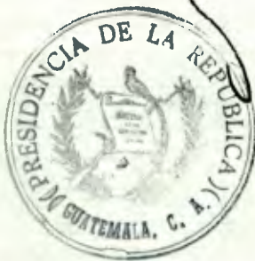
MARCO VINICIO CEREZO AREVALO Presidente

Aprovecho esta oportunidad para reiterar a Su Excelencia las seguridades de mi más alta consideración y personal estima,