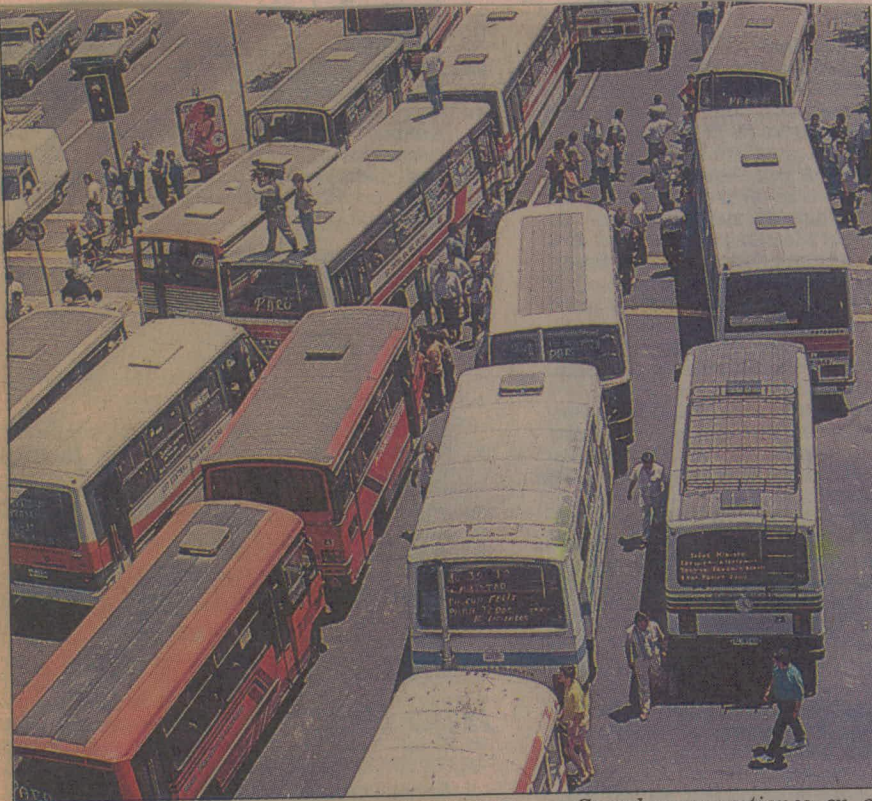
PROTESTAS DE MICROBUSEROS. — Grandes congestiones en el tránsito de Santiago provocaron ayer choferes y empresarios, en su mayoría de líneas de taxibuses, afectados por la ampliación del perímetro exclusivo para las líneas licitadas. Los conductores estacionaron sus vehículos en puntos claves de la ciudad, lo que obligó a la fuerza pública al despeje de vías y detención de manifestantes. (C 11)