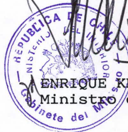
ENRIQUE KRAUSS RUSQUE Ministro del Interior