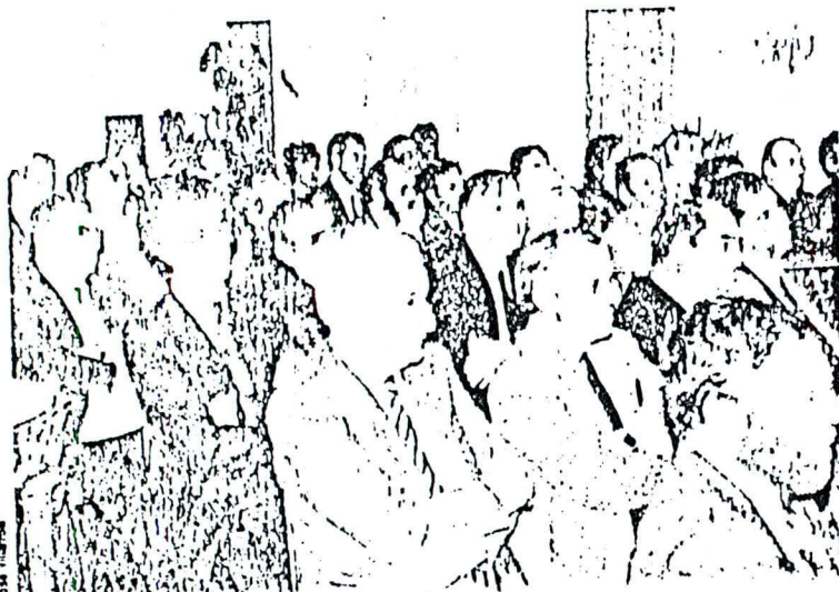
Representantes de diversos organismos públicos y privados concurren a la reunión.