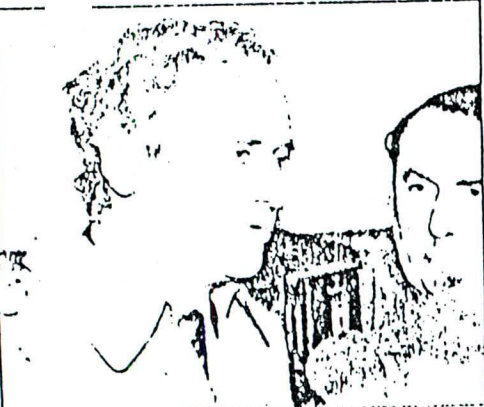
El ministro de Hacienda Alejandro Foxley, quien viaja hoy de regreso a la capital, inauguró ayer el Encuentro de Fomento Productivo y sostuvo una reunión con representantes de la región (información en página 5).