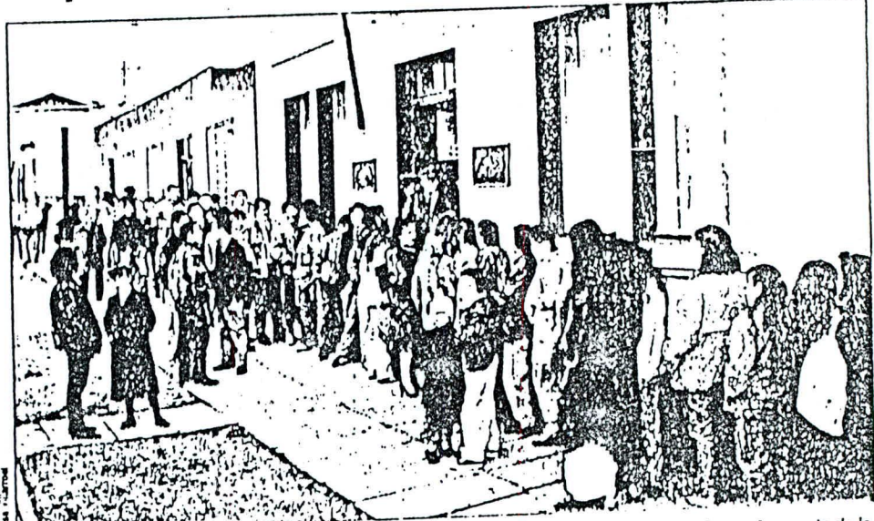
Cientos de personas, respondiendo a la tradición, concurren ayer a inscribirse a los registros electorales en el último día del plazo legal. Desde muy temprano se formaron largas colas las que fueron descendiendo a medida que fueron pasando las horas. La puerta de la oficina electoral se cerró exactamente a las 13 horas quedando a lo menos un centenar de rezagados que regresaron a sus hogares sin cumplir con el proceso.

Subvención por favor... Nueva línea aérea vendrá a la región