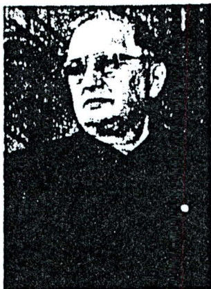
Intendente Roque Tomás Scarpa.

Por otra parte, añadió, en la provincia de Última Esperanza, "nos encontramos con un montón de expedientes de los años 1988 y 89 que no se había cursado y donde Bie-