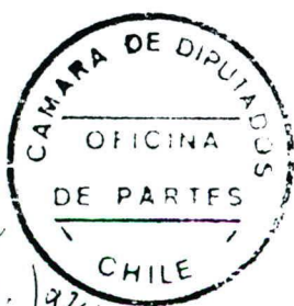
CARLOS SMOK U. DIPUTADO