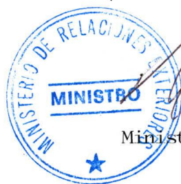
ENRIQUE SILVA CIMMA Ministro de Relaciones Exteriores