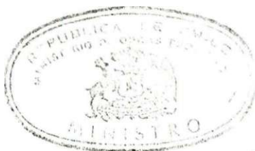
CARLOS HURTADO RUIZ-TAGLE Ministro de Obras Públicas

Sin otro particular los saluda muy atentamente,