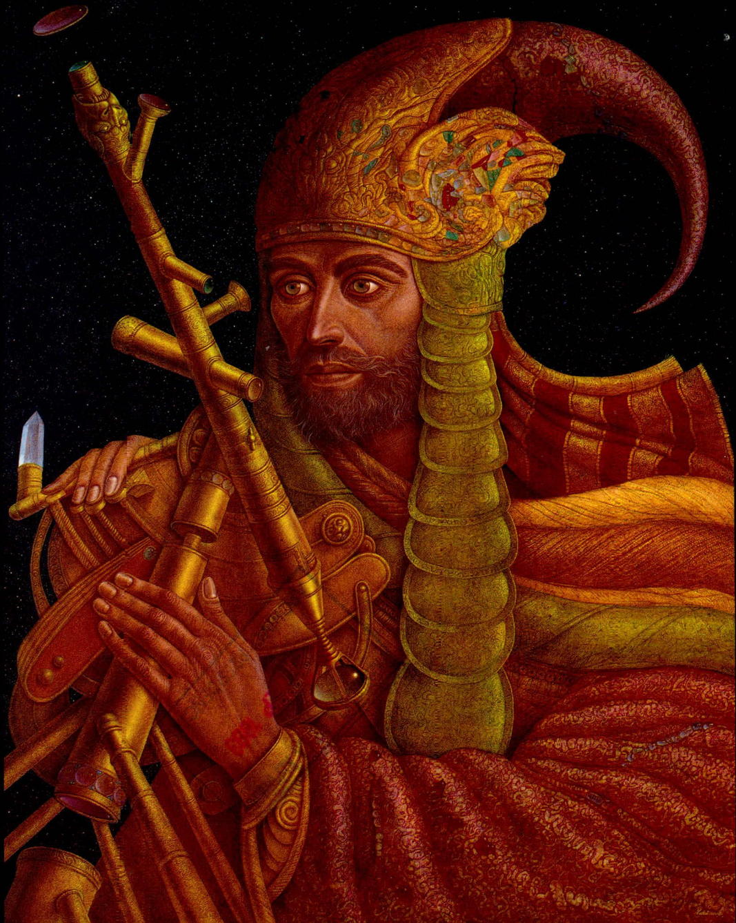
EL ASTRONOMO (Sobre el tiempo)