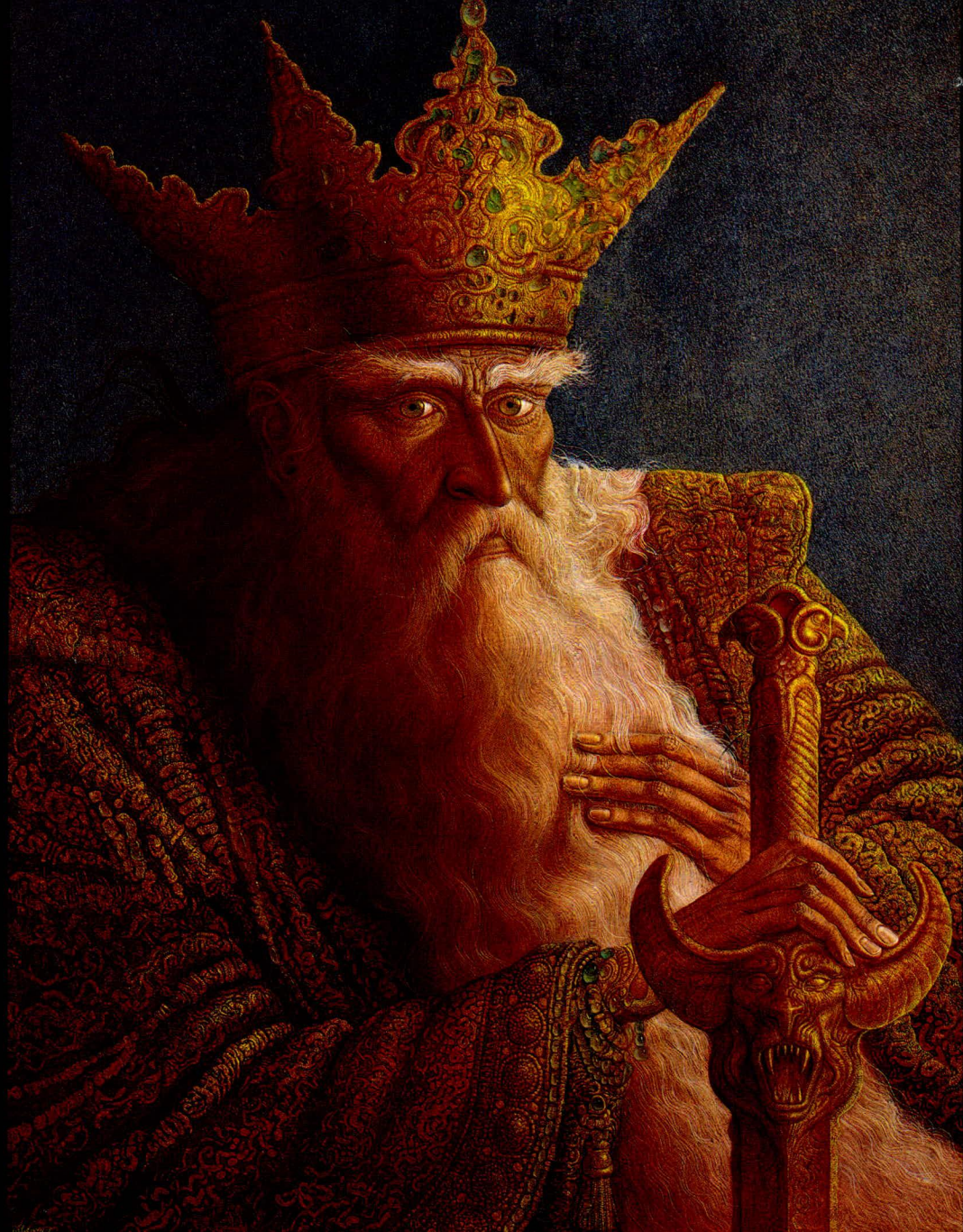
EL TIRANO (Sobre la Libertad)