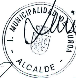
JAIIME CASTILLO SOTO ALCALDE DE NUÑO