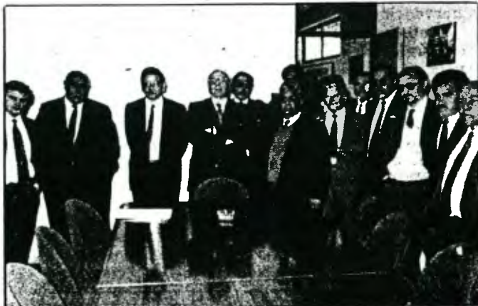
El Ministro René Abeliuk se reunió ayer en las dependencias del Parque Industrial Chacalluta con autoridades, miembros del directorio de ZOFRI y jefes de servicios dependientes de la Corporación de Fomento de la Producción (CORFO).

El personero manifestó que su presencia en Arica obedece al propósito de verificar el cumplimiento de la ejecución general del plan trazado por el Gobierno, en prepara-