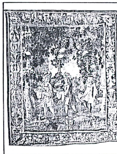
Tapicería Flamenca Siglo XVIII Personajes y Follajes

JOYAS: PRENDEDOR ANTIGUO CON SOLITARIOS DE BRILIANTE MONTADO